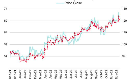
Central Pattana (CPN TB)